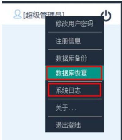
1、数据库恢复、系统日志

超级管理员账号为软件最高权限账号，可以定制部分软件运行模式，管理人员在第一次登陆后，请及时修改密码。