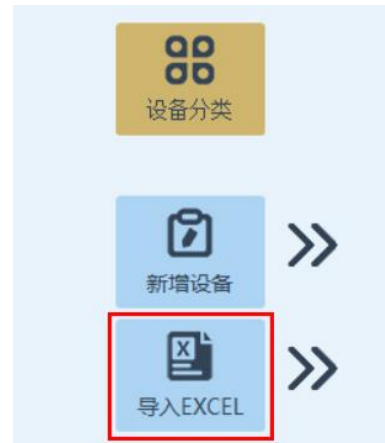
2、导入 EXCEL 文件功能